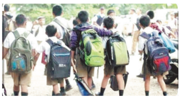
सरकार और प्रयासन की भूमिका जरूरी

शहर के स्कूलों में पढ़ने वाले छोटे-छोटे मासूम बच्चे आज शिक्षा के मंदिरों की ओर बढ़ते कदमों के साथ एक और चुनौती से जूझ रहे हैं। भारी भरकम स्कूली बस्तों का बोझ मात्र 20 से 30 किलो वजन वाले इन नन्हें बच्चों को रोजाना 6 से 10 किलो तक का बस्ता ढोना पड़ रहा है, जो न केवल उनके शारीरिक विकास को प्रभावित कर रहा है, बल्कि मानसिक और भावनात्मक विकास पर भी गहरा असर डाल रहा है। स्थानीय अभिभावकों का कहना है कि स्कूलों में हर विषय के लिए अलग-अलग किताबें, नोटबुक, प्रोजेक्ट सामग्री और अन्य जरूरी सामान रोज ले जाना पड़ता है, इससे बच्चों की पीठ दर्द, गर्दन में अकड़न और थकावट जैसी परेशानियां आम होती जा रही हैं। शिशु रोग विशेषज्ञों के अनुसार अधिक वजन उठाने से बच्चों के रीढ़ की हड्डी पर दबाव