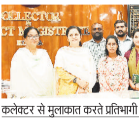
कलेक्टर से मुलाकात करते प्रतिभागी।

मनेन्द्रगढ़। श्री रामलला दर्शन योजना के अंतर्गत मनेन्द्रगढ़-चिरमिरी-भरतपुर जिले से चयनित 57 श्रद्धालुओं में से 52 श्रद्धालुओं का दल बुधवार की प्रातः कलेक्टर कार्यालय परिसर मनेन्द्रगढ़ से अयोध्या धाम के लिए रवाना हुआ। यह दल अंबिकापुर रेलवे स्टेशन से विशेष ट्रेन द्वारा श्रीरामलला के दर्शन के लिए पावन अयोध्या भूमि की यात्रा करेगा। राज्य शासन की इस महत्वपूर्ण योजना का उद्देश्य प्रदेश के श्रद्धालुओं को नि:शुल्क अयोध्या यात्रा का सौभाग्य प्रदान करना है। योजना के तहत